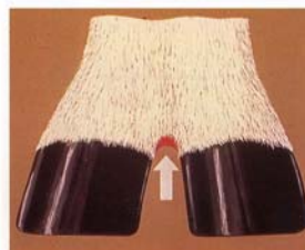
Stade 1: Légère dermatite

Stade 4 = Infection et inflammation, désengrènement de la corne du sabot et en 1 mois, chute complète de l'onglon..... = 4 croix = XXXX