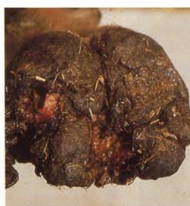
Stade final: Chute de l'onglon ou développement anarchique de la corne