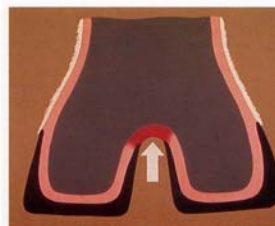
Stade 2: Dermatite avec exsudat