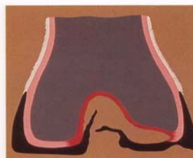
Stade 4: Nécrose touchant la corne dure et décollement de l'onglon