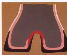
Stade 3: Nécrose touchant la corne tendre